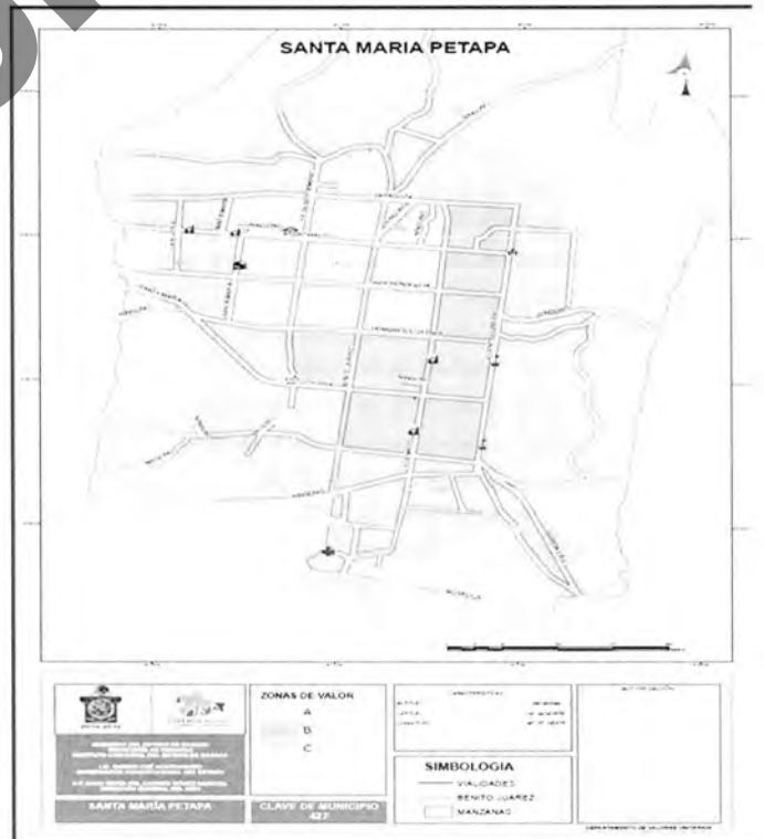
PLANO DE ZONIFICACIÓN CATASTRAL

Artículo 24. La tasa de este impuesto será del 0.5% anual sobre el valor catastral del inmueble.