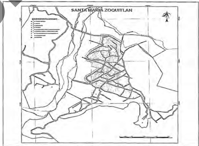
PLANO DE ZONIFICACIÓN CATASTRAL

Artículo 17. La tasa de este impuesto será del 0.5% anual sobre el valor catastral del inmueble.