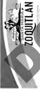
PADRON DE CONTRATISTAS 2025